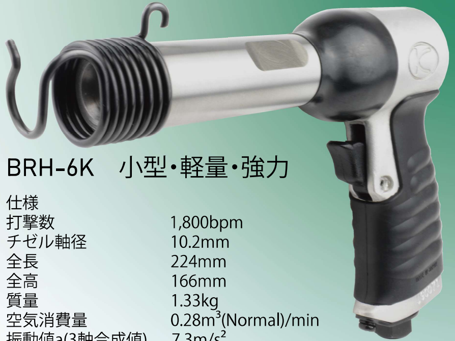
BRH-6K 小型・軽量・強力